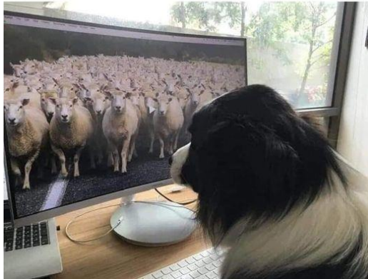
Kanadský vtip od Smetáka

This is Wilson. He is now working from home 😊